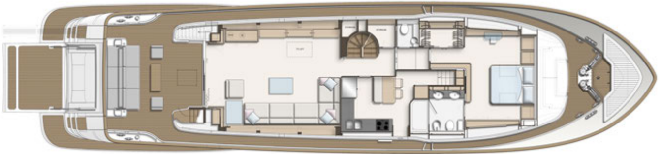
MAIN DECK A